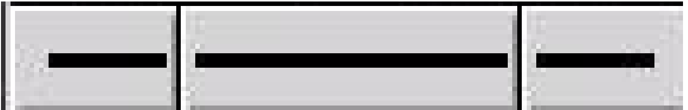
Figure 3.3: Marraren propietateak

Marrak erraz edita daitezke geziak eta horrelako elementuak sortzeko. Tresna-koadroaren behealdean 3 botoi daude marrekin. Klik egin eta sakatuta edukita, menu bat azalduko da aldaketaren emaitza ikusteko.